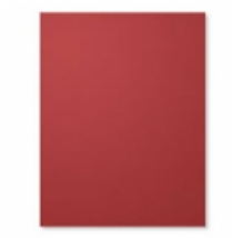
Cherry Cobbler A4 Card Stock [121681] € 10,50