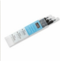
Blender Pens [102845] € 14,50