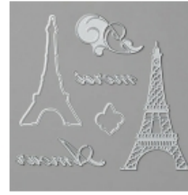
Parisian Dies [151465] € 33,00