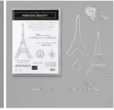
Parisian Beauty Bundle (English) [153778] € 52,00