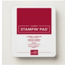
Cherry Cobbler Classic Stampin' Pad [147085] € 9,00