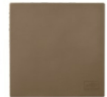
Silicone Craft Sheet [127853] € 7,50