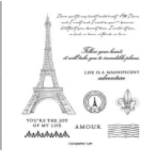
Parisian Beauty Cling Stamp Set (English) [151466] € 25,00