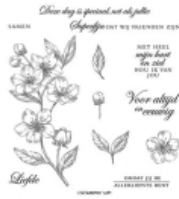
Nieuwe Bloesems Cling Stamp Set (Dutch) [152427] € 28,00