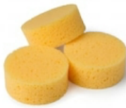
Stamping Sponges [141537] € 4,75