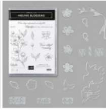
Nieuwe Bloesems Bundle (Dutch) [153784] € 64,75