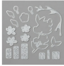
Cherry Blossoms Dies [151456] € 44,00