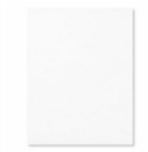
Whisper White A4 Card Stock [106549] € 11,75