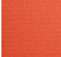
Scripty 3D Embossing Folder [149654] € 12,00