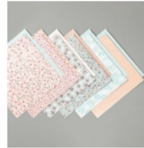
Parisian Blossoms Specialty Designer Series Paper [151192] € 18,00