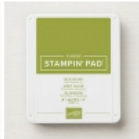
Old Olive Classic Stampin' Pad [147090] € 9,00