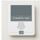
Basic Gray Classic Stampin' Pad [149165] € 9,00