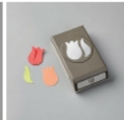
Tulip Builder Punch [151295] € 22,00