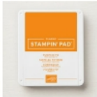
Pumpkin Pie Classic Stampin' Pad [147086] € 9,00