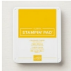
Crushed Curry Classic Stampin' Pad [147087] € 9,00